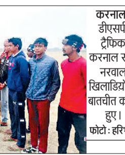
करनाल। डीएसपी ट्रैफिक करनाल सौ नरवाल खिलाडियों से बातचीत करते हुए।

बीच बेहतर संबंध को बढ़ावा देने के उद्देश्य से शुरू किए गए हैं। इन आउटरीच प्रोग्रामों के तहत जिला करनाल सहित प्रदेश भर में समय-समय पर विभिन्न प्रोग्राम जैसे नशे के खिलाफ अभियान, साइकिल