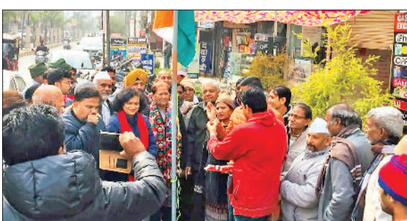
अंबाला। कांग्रेस भवन में एकजुट कांग्रेसी, झंडा फहराने के बाद लड्डू बाँटते कार्यकर्ता।

कांग्रेस की ओर से वीरवार को अंबाला शहर व छावनी में पार्टी का स्थापना दिवस मनाया गया। इस दौरान कांग्रेसियों ने एकजुट होकर पार्टी को मजबूत बनाने का भी संकल्प लिया। अंबाला शहर के कांग्रेस भवन में अखिल भारतीय कांग्रेस कमेटी की ओर से स्थापना दिवस के कार्यक्रम का आयोजन किया। कांग्रेस सेवादल के प्रधान