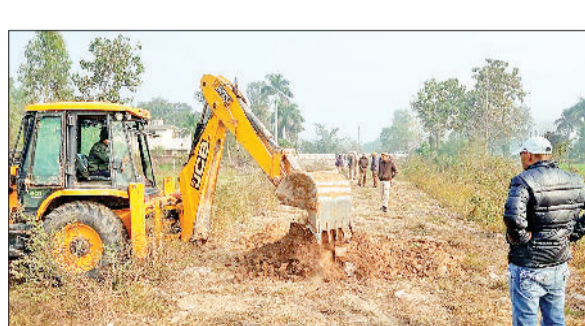
अंबाला। अवैध कॉलोनी में कच्ची सड़कों तोड़ती जेसीबी।