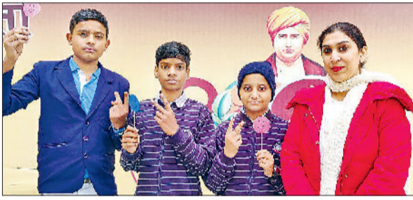
पानीपत। आर्य स्कूल में विजेता विद्यार्थी अपनी टीचर के साथ प्रसन्न मुद्रा में।