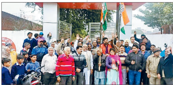
करनाल। कांग्रेस पार्टी के स्थापना दिवस पर पार्टी का ध्वज फहराते कांग्रेस कार्यकर्ता।