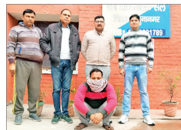
यमुनानगर की एंटी नारकोटिक सेल की टीम द्वारा पकड़ा गया आरोपी युवक।