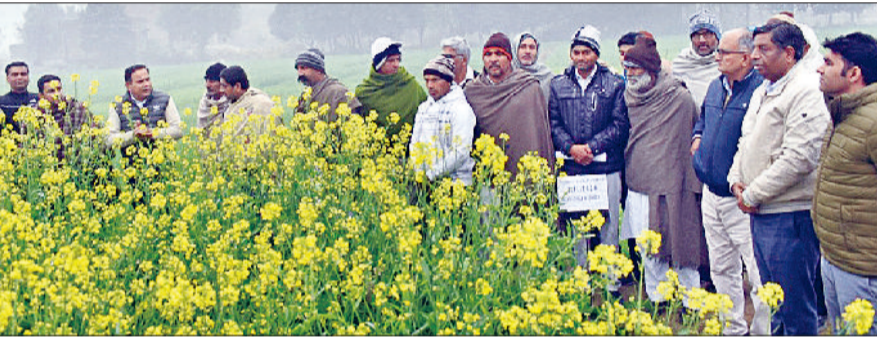
पानीपत। कृषि विज्ञान केंद्र में सरसों की फसल का अवलोकन करते हुए किसान व कृषि वैज्ञानिकगण।

चौधरी चरण सिंह हरियाणा कृषि विश्वविद्यालय के कृषि विज्ञान केंद्र गांव ऊझा, पानीपत में गन्ना आधारित फसल विविधीकरण एक दिवसीय जागरूकता कार्यक्रम का आयोजन किया गया। इस कार्यक्रम में पानीपत जिले के किसानों ने भाग लिया। इस कार्यक्रम का मुख्य उद्देश्य किसानों को फसल विविधीकरण के लिए प्रेरित कर उन्हें आर्थिक तौर से सशक्त बनाना था तथा गन्ने की फसल के क्षेत्रफल व उत्पादन में वृद्धि करना व मिट्टी की उपजाऊ शक्ति को प्राकृतिक तरीके से बढ़ाने के उपायों पर जागरूकता करना था। इसके