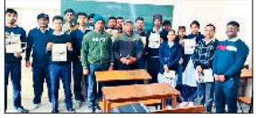
करनाल। सेमिनार आयोजित कर बच्चों से बातचीत करते हुए फाउंडेशन के पदाधिकारी।