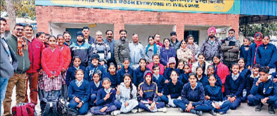
इंद्री। राजकीय वरिष्ठ माध्यमिक विद्यालय इंद्री में पठन प्रोत्साहन के तहत आयोजित भाषा प्रतियोगिताओं के विजेता अधिकारियों व अध्यापकों के साथ।