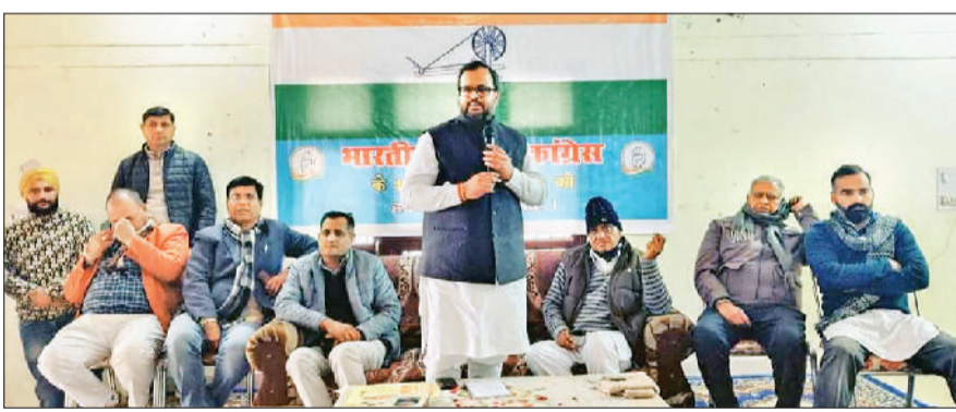
बराड़ा। कार्यक्रम में लोगों को संबोधित करते विधायक वरुण चौधरी।

भारतीय राष्ट्रीय कांग्रेस के 138 वें स्थापना दिवस के उपलक्ष्य पर मुलाना हल्के के गांव दुराना में कांग्रेस कार्यकर्ताओं द्वारा कार्यक्रम आयोजित किया। इसमें मुलाना विधायक वरुण चौधरी ने शिरकत कर उपस्थित कांग्रेस कार्यकर्ताओं को कांग्रेस पार्टी के स्थापना दिवस पर शुभकामनाएं दी। विधायक ने कांग्रेस पार्टी के इतिहास पर बोलते हुए कहा कि कांग्रेस पार्टी की स्थापना 28 दिसम्बर 1885 को मुंबई में हुई थी। डब्ल्यूसी बैनर्जी कांग्रेस के पहले अध्यक्ष बने। उन्होंने अपने अध्यक्षीय भाषण में देश में