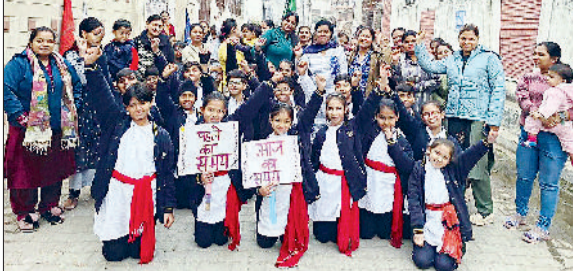
पानीपत। मोबाइल फोन के अधिक प्रयोग के विरुद्ध जनता को जागरूक करते हुए प्रयाग इंटरनेशनल स्कूल के विद्यार्थी।

वातानुकूलित बस फरवरी माह तक प्राप्त होगी। इससे आवागमन सुचारु होगा।