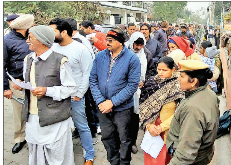
अंबाला। गृहमंत्री आवास के बाहर लगी लोगों की लाइन।