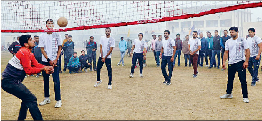
पानीपत। युवा खेल महोत्सव में वॉलीबॉल खेलते हुए खिलाड़ी।