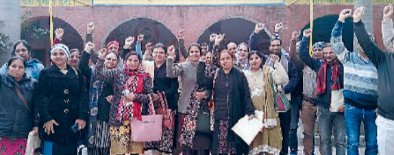
इंद्री। खंड शिक्षा कार्यालय इंद्री में खराब भोजन मिलने से खफा अध्यापक नारेबाजी करते हुए।

खंड शिक्षा कार्यालय इंद्री में जिला प्रशिक्षण संस्थान शाहपुर, करनाल की ओर से शिक्षा विभाग के विभिन्न कर्मचारियों व अध्यापकों के लिए कर्मयोगी प्रशिक्षण के लिए कार्यशाला आयोजित की गई। जिसमें खंड इंद्री के लगभग 60 अध्यापकों ने भाग लिया। इस प्रशिक्षण संस्थान के दौरान अध्यापकों को कर्मयोगी बनने के लिए अनेक उदाहरणों के द्वारा प्रशिक्षित किया गया। इस प्रशिक्षण में अध्यापकों की कार्यक्षमता बढ़ाने के लिए व उनके कार्यों के