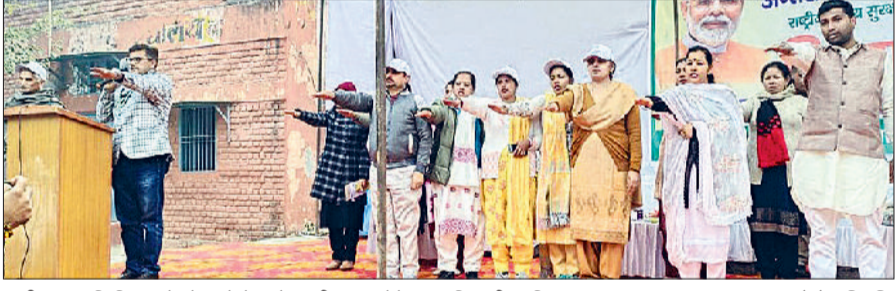
पानीपत। कृषि विभाग के मेला में देश सेवा की शपथ लेते हुए अधिकारी आदि।